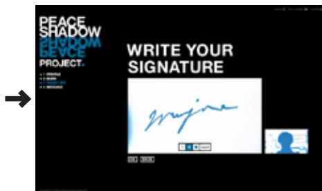
サインを書きこみます