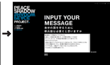
核兵器にまつわる質問に答えます