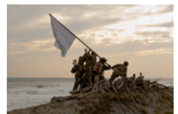
映像作品《海の幸・戦場の頂上の旗》2010