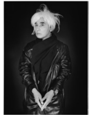
《なにものかへのレクイエム (創造の劇場／動くウォーホル)》2010