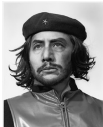
《なにものかへのレクイエム (遠い夢/チェ)》2007