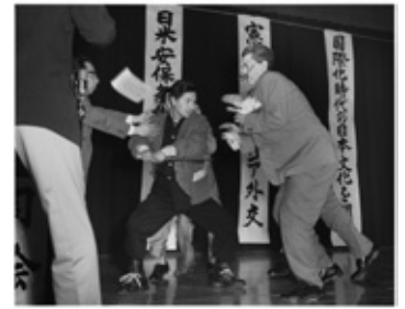
《なにものかへのレクイエム (ASANUMA1 1960.10.12-2006.4.2)》2006