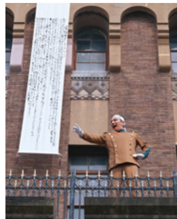
《なにものかへのレクイエム (MISHIMA 1970.11.25-2006.4.6)》2006