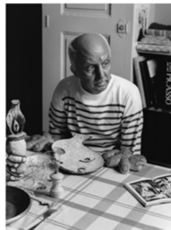
《なにものかへのレクイエム (創造の劇場/パブロ・ピカソとしての私)》 2010