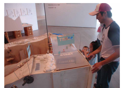
「青葉緑日2」(せんだいメディアテーク 2007) KOSUGE 1-16 作品展示風景

※友達同士なども1枚のはがきもしくはメールで一緒に申し込むことができます。 ※メールでのお申し込みについては、締切の翌日までに受付完了の返信メールをお送りします。届かない場合はご連絡ください。 ※締切後でも定員に満たない場合は参加を受け付けますので、当館ホームページで確認いただくか、電話でお問い合わせください。