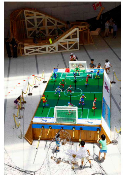
「こどものにわ」(東京都現代美術館 2010) KOSUGE 1-16 作品展示風景

絵描きのおじさんが小さい頃に遊んでいたような昔懐かしいおもちゃ、操り人形や板返しや赤ベコなど…。本展参加アーティスト・KOSUGE 1-16と一緒に、それらの仕組みを使って仕掛けを大きくさせたり、違うルールを作ったりと、「むかしあそび」を「いまのあそび」に変えて遊びます。