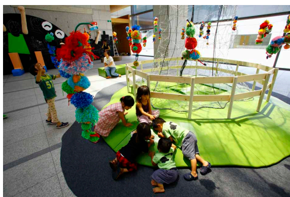
「こどものにわ」（東京都現代美術館 2010） KOSUGE 1-16 作品展示風景

さらに、アーティストによるワークショップも会期中2度にわたって開催します。操り人形や板がえし、赤ペコなどの昔懐かしいおもちゃの仕組みを使って、仕掛けを大きくしたり、違うルールを作ったり。「むかしあそび」を「いまのあそび」に変換して、アーティストと一緒に新たな楽しみを創作します。