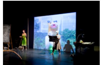
ジョーン・ジョナス《Reading Dante II》2009

本展は、身体の「動き」を作品に取り入れたパイオニアから若手作家の試みまで、異なるジェネレーションのアーティストの活動を紹介します。展覧会という2ヶ月間継続して幕の開く舞台上で、またステージと客席の別れていない展示室という劇場で、アーティストたちは美術作品の形式や展覧会の慣例を問いかけながら、作品と場所、演者と鑑賞者との間にユニークな関わりを築いてゆきます。