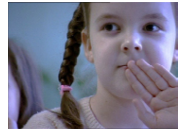
ヴィクトル・アリンピエフ 《Summer Lightnings》2004