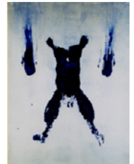
イヴ・クライン《人体測定 170》1960