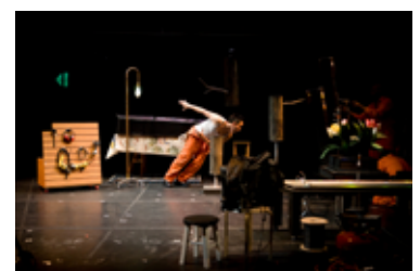
ヤンドゥ・ジョン《Cinamagician》2009